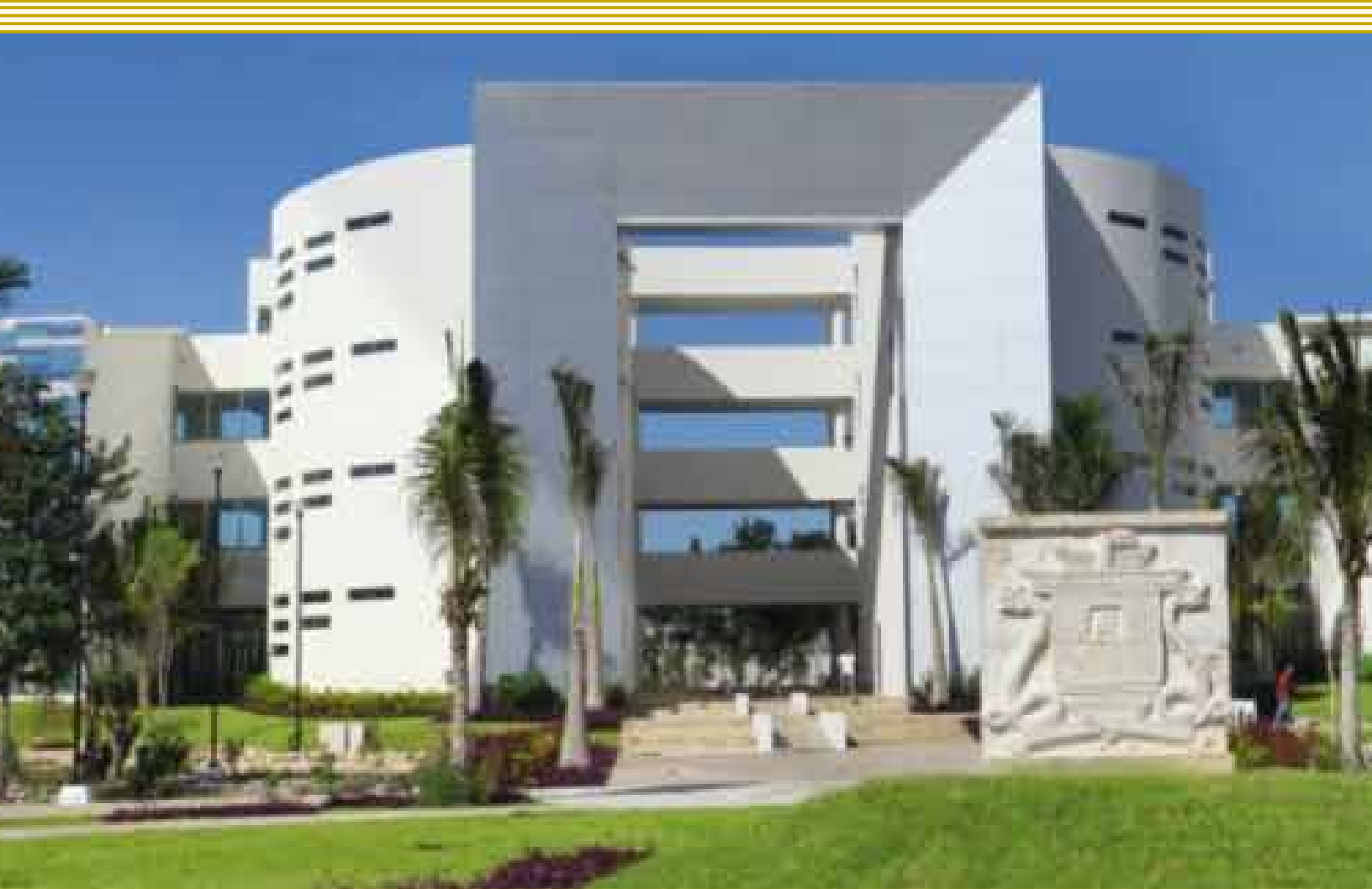
Acceso principal Unidad Académica Playa del Carmen