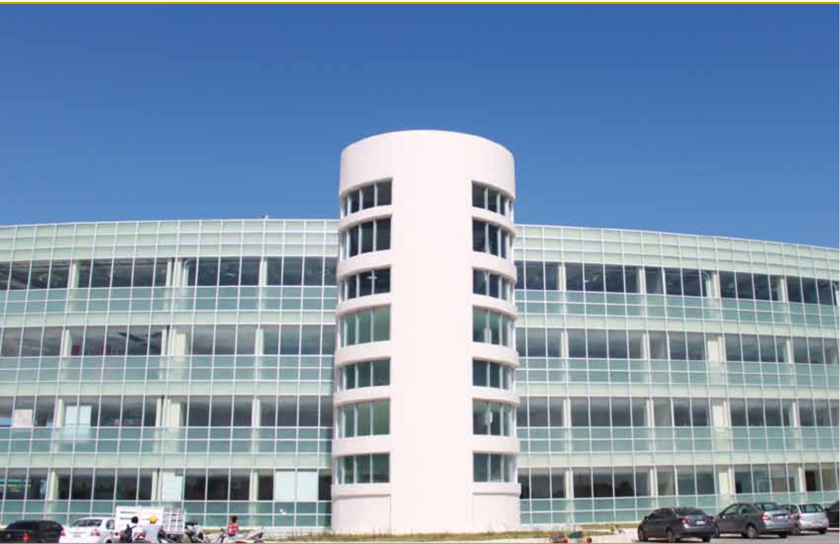
Edificio principal División de Ciencias de la Salud