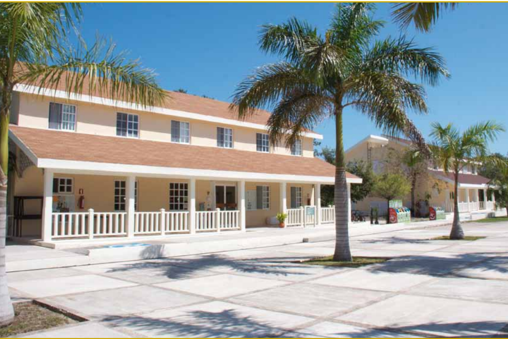
Edificio administrativo Unidad Académica Cozumel