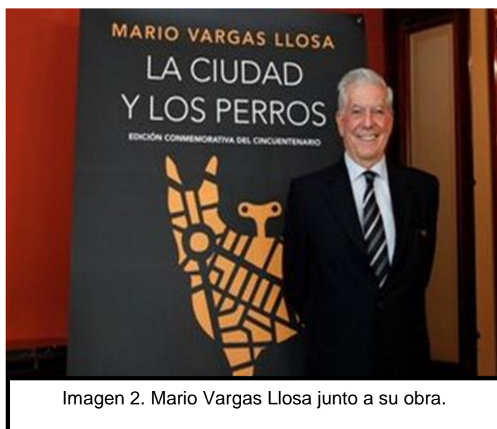
Imagen 2. Mario Vargas Llosa junto a su obra.

ocasiones repercute en la personalidad y conducta de los jóvenes. Asimismo, este tipo de vida hace que los estudiantes al vivir con muchas privaciones busquen medios de escape donde la mayoría de las veces son los peores caminos. Otro de los aspectos que hay que mencionar, es la del más fuerte, ya que se puede apreciar como los jóvenes más débiles sucumben ante los alumnos más fuertes. Además, otro factor fundamental que denuncia la obra es el machismo, como el caso del personaje del esclavo quien es enviado a este colegio porque su padre desea que se haga un hombre. Por consecuencia, se puede apreciar como estos jóvenes tratan de demostrar su hombría frente a los demás.