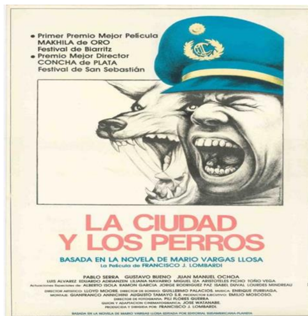
Imagen 5. Adaptación de la novela La ciudad y los perros .

Por otro lado, el término despectivo “perros” se utiliza para referirse a los nuevos estudiantes marcando un tipo de jerarquización en la cual se señala la clase de alumno que es, marcando el trato que debe recibir y el trato que le debe dar a sus mayores. Siendo por medio del lenguaje y el trato donde los estudiantes son deshumanizados al ser tratados con violencia. Por otra parte, es a partir de los apodos que se imponen que puede apreciar el rango de supremacía y la imposición que se puede ejercer sobre el otro. Por otra parte, en desacuerdo con todo esto algunos jóvenes de grados inferiores forman un grupo que decide vengarse de los estudiantes de cuarto grado. Asimismo, este grupo lo lidera el alumno llamado el Jaguar, donde planea ataques contra sus enemigos y es aquí donde se adopta actitudes viriles por parte de los alumnos inferiores para demostrar su superioridad y evitar ser devorados por los demás. (Vargas, 2018).