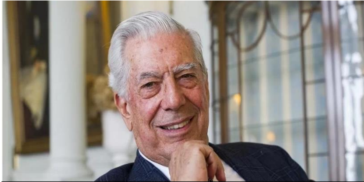
Imagen 3. Retrato de Mario Vargas Llosa.

Poco después ingresó en la Universidad de San Marcos de Lima, donde cursó estudios de literatura (Ruiza et al, 2004).