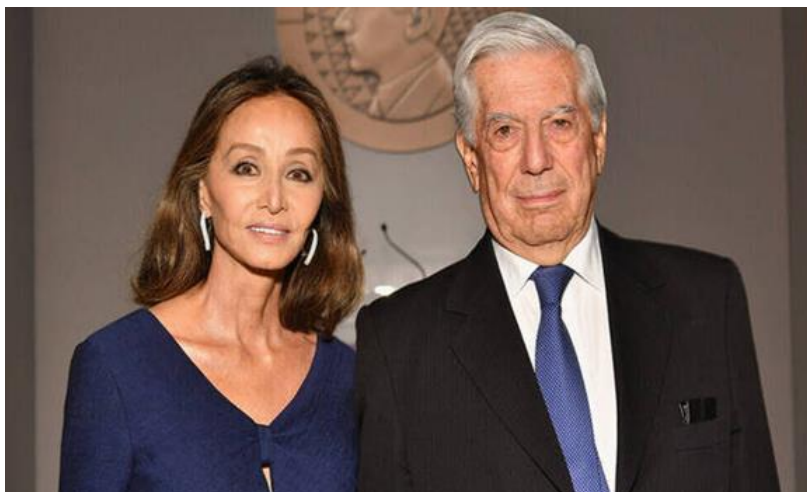
Imagen 4. Isabel Preysler y Mario Vargas Llosa.