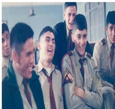
Imagen 6. Adaptación cinematográfica de 1985.

Es aquí, donde interfiere el alumno que lleva el nombre de Alberto al sospechar quien podría ser culpable de la muerte de su amigo. Por ello, denuncia sus especulaciones sobre el Jaguar ante el teniente Gamboa, donde sospecha que él ha sido el asesino de su amigo. La intervención del teniente Gamboa no sirve de nada al no tener pruebas suficientes y por otra parte sus superiores se niegan a dañar la imagen de la institución. Aquí se puede ver la gran corrupción en la red del sistema educativo donde hoy en día aún existen en muchas escuelas. Como consecuencia, ordenan el traslado del teniente Gamboa y los alumnos son castigados por la información que ha aportado Alberto. Equivocadamente, los demás cadetes empiezan a sospechar que es el Jaguar quien los delató y empiezan a tratarlo mal. Para terminar, el Jaguar, triste por la actitud de sus amigos le confiesa al teniente Gamboa que fue él quien cometió el crimen y arrepentido quiere acatar las consecuencias de sus actos. Pero el teniente le recomienda aprender de su error y a corregir su vida. (Vargas, 2018).